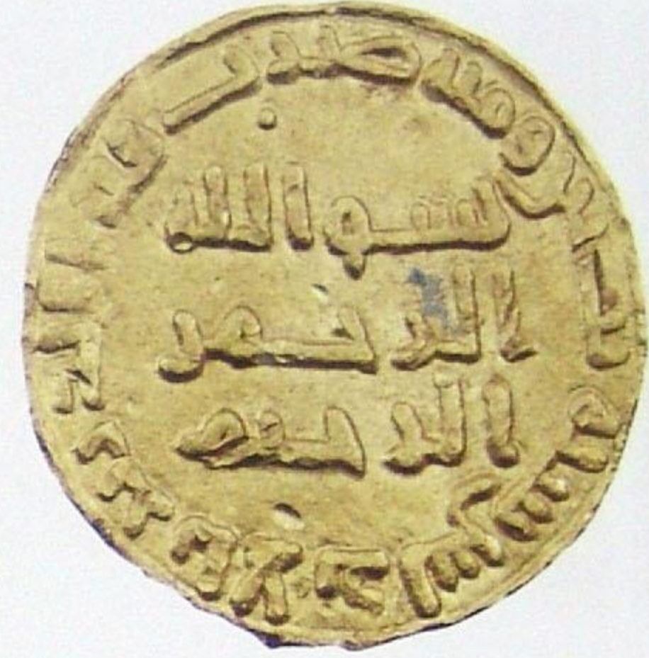
دينار أموي يزيد بن عبد الملك ضرب: الأندلس سنة: ١٠٢ هجري